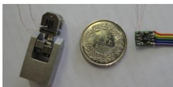
Bild 2. PCB verwendete für Spannungsmessungen und Greifer

So kann auf Vorverstärkung verzichtet werden, was bei den extrem engen Platzverhältnissen von Vorteil ist. Eine Verbindung mit dieser Platte wird mit Hilfe eines SPI Serie-bus realisiert. Dazu wurde eine auf dem ATMEL Mikrokontroller basierte Platte zum Erstellen einer USB zur SPI Schnittstelle entwickelt.